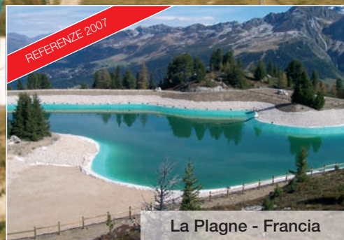
La Plagne - Francia