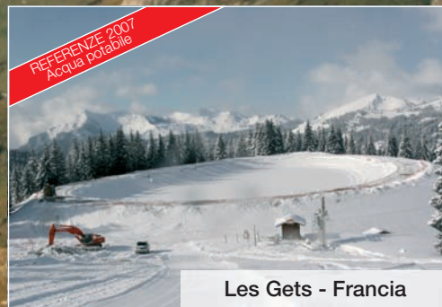
Les Gets - Francia