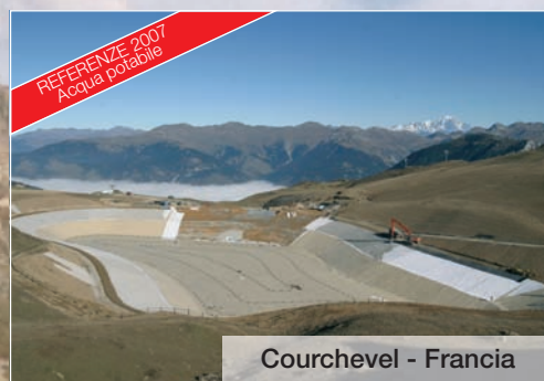
Courchevel - Francia