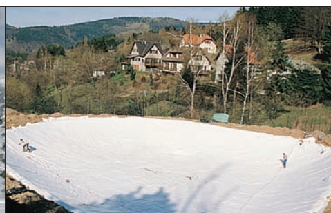
SERBATOI E BACINO D'ACQUA POTABILE

VANTAGGI > ACQUA NON TRATTATA STAMOID® 1250 / 1300