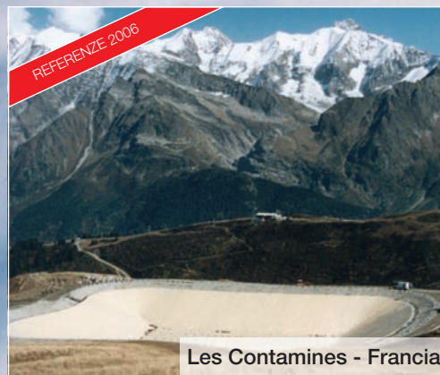
Les Contamines - Francia

Un know-how riconosciuto ed un servizio di prossimità nel cuore delle Alpi